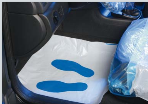
Ochrana podlahy se stopou nohy (obj. č. D-T 95 F) z bílého polyetylénu s potiskem.