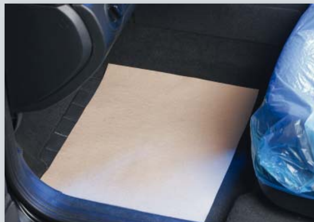
Ochrana podlahy (obj. č. D-T 27)