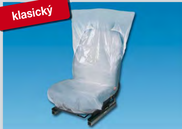
Potah na sedadlo „Classic“ (obj. č. D-E 35)

z polyetyleny, barva: bílá, velikost: 790 x 1300 mm, 500 ks v jedné roli.