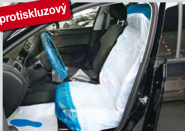
Potah na sedadlo „Optifit“ (obj. č. D-E 2000)

protiskluzová spodní vrstva, z polyetyleny, barva: bílá/modrá, velikost: 790 x 1330 mm, 500 ks v jedné roli.