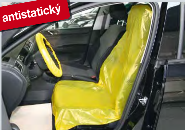
Potah na sedadlo „antistatický“ (obj. č. D-E 3000)

chrání elektronické přístroje od elektrostatického výboje, vhodný na všechna samostatná sedadla, z extra silného polyetyleny, s antistatickým podílem materiálu, žlutá rozlišovací barva, velikost: 840 x 1400 mm, 250 ks v jedné roli.