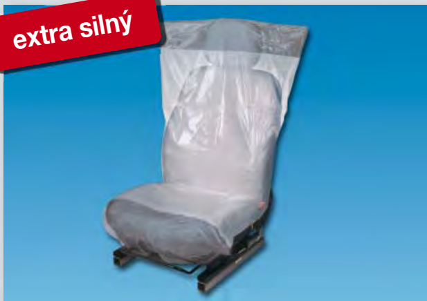
Optifit deluxe (obj. č. D-E 2300)

extra silný, protiskluzová spodní vrstva, z extra silného polyetyleny, barva: bílá/stříbrná, velikost: 790 x 1330 mm, 300 ks v jedné roli.