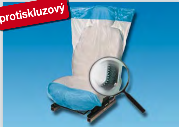
Potah na sedadlo „Optifit“ (obj. č. D-E 2000)

protiskluzová spodní vrstva, z polyetylénu, barva: bílá/modrá, velikost: 790 x 1330 mm, 500 ks v jedné roli.