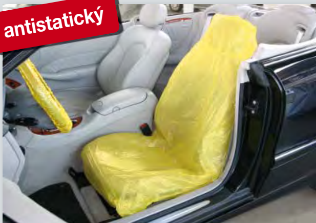
Potah na sedadlo „antistatický“ (obj. č. D-E 3000)

chrání elektronické přístroje od elektrostatického výboje, vhodný na všechna samostatná sedadla, z extra silného polyetylénu, s antistatickým podílem materiálu, žlutá rozlišovací barva, velikost: 840 x 1400 mm, 250 ks v jedné roli.