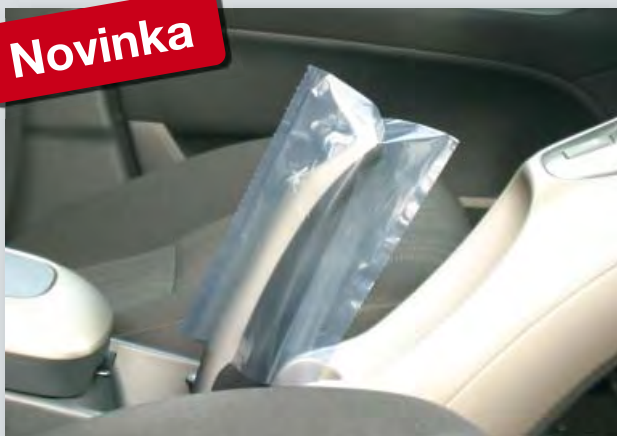
Jednorázová ochrana ruční brzdy (obj. č. D-HB 2010) z polyetylenu, průhledná, na kompaktní roli, velikost: 100 x 180 mm, 500 ks v jedné roli.