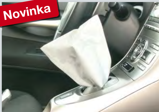
Jednorázová ochrana řadicí páky (obj. č. D-SH 2020) z polyetylenu, bílá, na kompaktní roli, velikost: 145 x 160 mm, 500 ks v jedné roli.