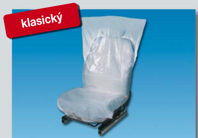
Potah na sedadlo „Classic“ (obj. č. D-E 35)