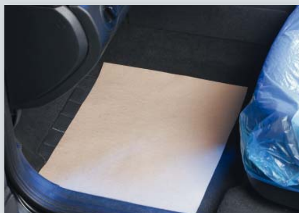
Ochrana podlahy (obj. č. D-T 27)