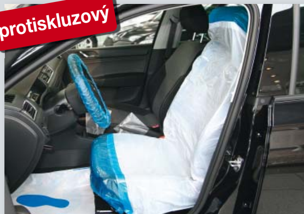
Potah na sedadlo „Optifit“