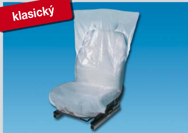
Potah na sedadlo „Classic“