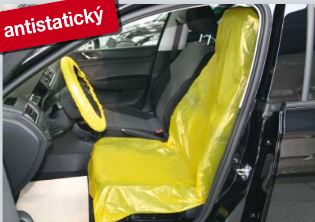
Potah na sedadlo „antistatický“ (obj. č. D-E 3000)

chrání elektronické přístroje od elektrostatického výboje, vhodný na všechna samostatná sedadla, z extra silného polyetylénu, s antistatickým podílem materiálu, žlutá rozlišovací barva.