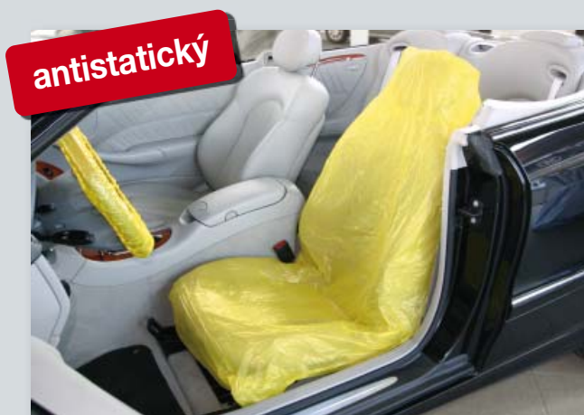
Potah na sedadlo „antistatický“ (obj. č. D-E 3000)

chrání elektronické přístroje od elektrostatického výboje, vhodný na všechna samostatná sedadla, z extra silného polyetyleny, s antistatickým podílem materiálu, žlutá rozlišovací barva.