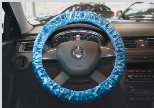
Ochranný potah na volant pro mnohonásobné použití (obj. č. D-L 20)

s elastickou gumou, pro osobní automobily, z extra silného polyetylenu, barva: modrá.