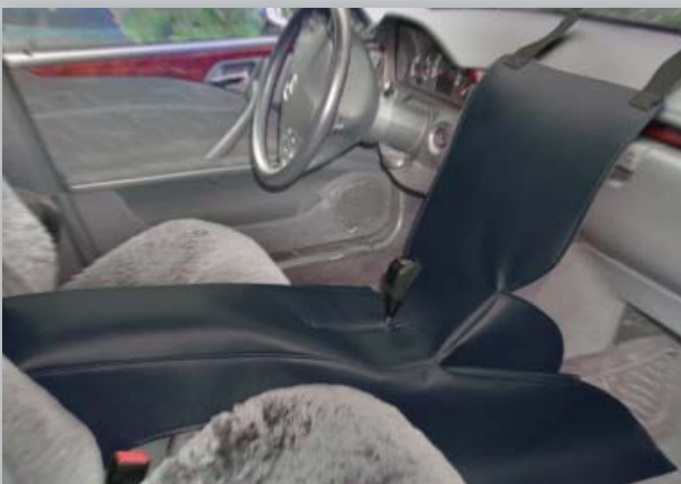
Potah pro středovou konzolu (obj. č. D-M 07)

Velikost: přibl. 220 x 135 cm Váha: přibl. 1,0 kg Balení: 1 kus