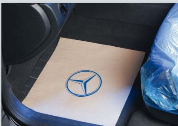
Ochrana podlahy s logem MB (obj. č. D-T 27 MB)

Balení: 500 ks v jedné kompaktní roli, Váha: přibl. 7,1 kg