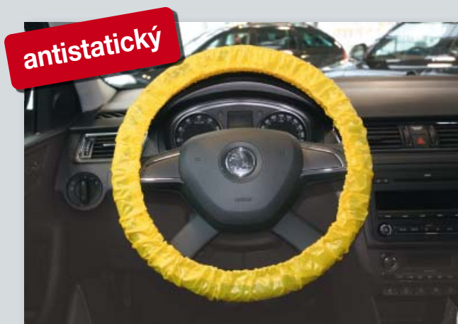
Ochranný potah na volant pro mnohonásobné použití „antistatický“ (obj. č. D-L 3100)

chrání elektronické přístroje od elektrostatického výboje, s elastickou gumou, pro osobní a nákladní automobily, z extra silného polyetylenu, s antistatickým podílem materiálu, žlutá rozlišovací barva.