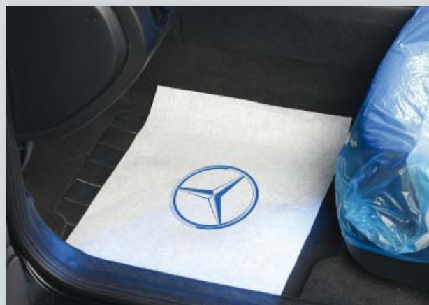
Ochrana podlahy s logem MB (obj. č. D-T 26 MB)