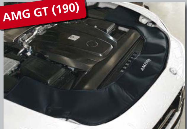
AMG GT (190)