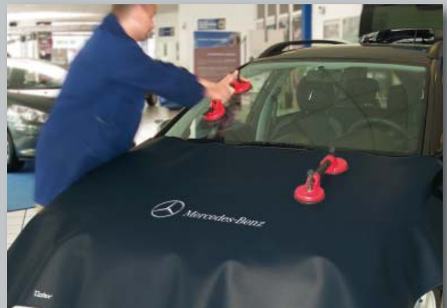
Ochranný potah pro kapotu (obj. č. D-M 06-05)

Velikost: přibl. 110 x 72 cm Váha: přibl. 0,6 kg Balení: 1 kus