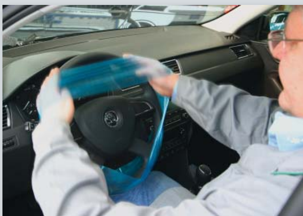
Ochranný potah na volant pro jednorázové použití (obj. č. D-L 18)

pro volanty osobních a nákladních automobilů, polyetylen, velmi roztahitelný.