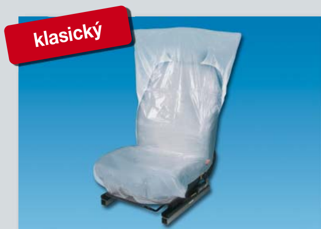
Potah na sedadlo „Classic“ (obj. č. D-E 35)