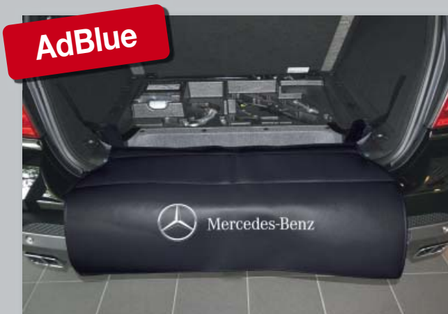
Zadní ochranný potah, vhodný při plnění nádrže AdBlue (obj. č. D-M 10-02)

Chrání nárazník a koberec, s dodatečným silným vyztužením. Speciálně vyvinuto pro vozidla s nádrží AdBlue. Přichycení pomocí suchých zipů. Vyrobeno z odolné černé koženky s vrstvou pěnové pryže. S logem podporujícím image dílny.