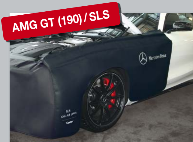
AMG GT (190) / SLS