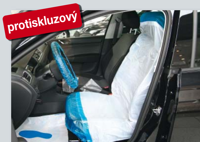
Potah na sedadlo „Optifit“ (obj. č. D-E 2000)

protiskluzová spodní vrstva, z polyetyleny, barva: bílá/modrá.