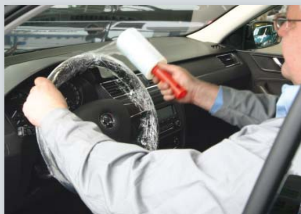
Ochrana volantu a řadicí páky pro jednorázové použití (obj. č. D-L 42)

Pro volanty osobních a nákladních automobilů, adhesivní fólie s držadlem, polyetylen, pro ca 250 použití.