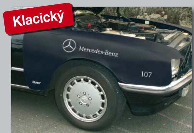
Různé speciální potahy

Velikost: přibl. 110 x 150 cm Váha: přibl. 0,6 kg Balení: 1 kus