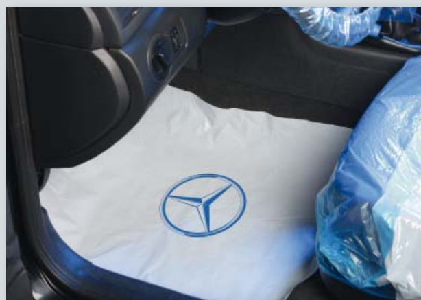
Ochrana podlahy s logem MB (obj. č. D-T 95 MB)

Balení: 500 ks v krabici, Váha: přibl. 16,0 kg