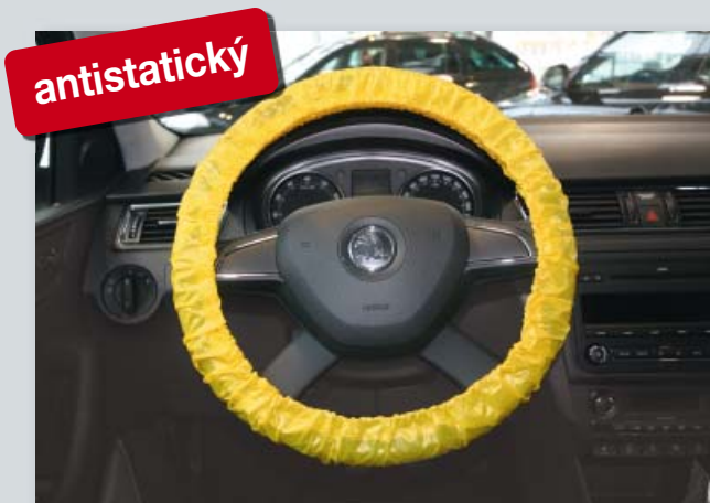
Ochranný potah na volant pro mnohonásobné použití „antistatický“ (obj. č. D-L 3100)

chrání elektronické přístroje od elektrostatického výboje, s elastickou gumou, pro osobní a nákladní automobily, z extra silného polyetylenu, s antistatickým podílem materiálu, žlutá rozlišovací barva.