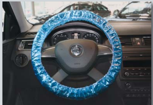
Ochranný potah na volant pro mnohonásobné použití (obj. č. D-L 20)

Balení: 20 ks v krabici Váha: přibl. 0,7 kg