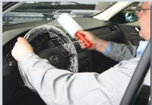
Ochrana volantu a řadicí páky pro jednorázové použití (obj. č. D-L 42)

Balení: 500 ks v roli Váha: přibl. 2,9 kg