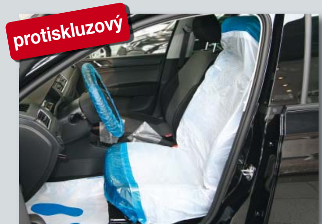
Potah na sedadlo „Optifit“ (Datex obj. č. D-E 2000 **)

protiskluzová spodní vrstva, z polyetylenu, barva: bílá/modrá.