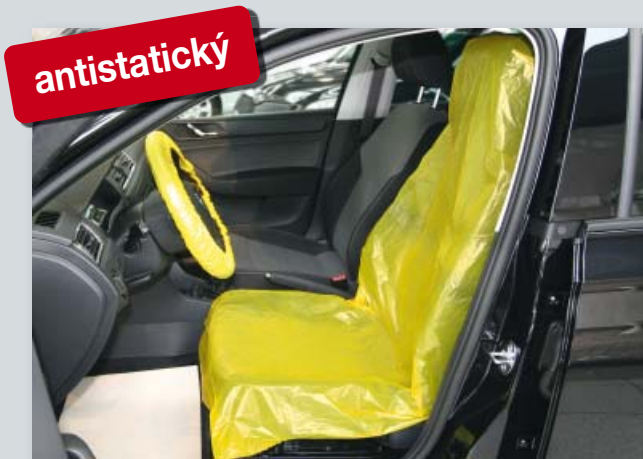
Potah na sedadlo „antistatický“ (Datex obj. č. D-E 3000 **)

chrání elektronické přístroje od elektrostatického výboje, vhodný na všechna samostatná sedadla, z extra silného polyetylenu, s antistatickým podílem materiálu, žlutá rozlišovací barva.