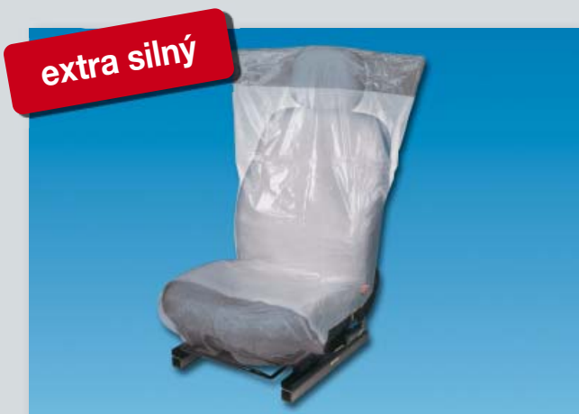
Optifit deluxe (Datex obj. č. D-E 2300 **)

extra silný, protiskluzová spodní vrstva, z extra silného polyetylenu, barva: bílá/stříbrná.