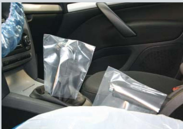
Jednorázový potah na řadicí páku a ruční brzdu z průhledného polyetylénu. (Datex obj. č. D-SH 2020 **)