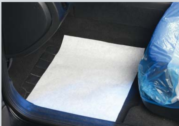
Ochrana podlahy (Datex obj. č. D-T 26 **)

Balení: 500 ks na kompaktní roli, Váha: přibl. 6,3 kg