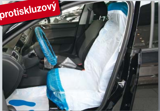
Potah na sedadlo „Optifit“