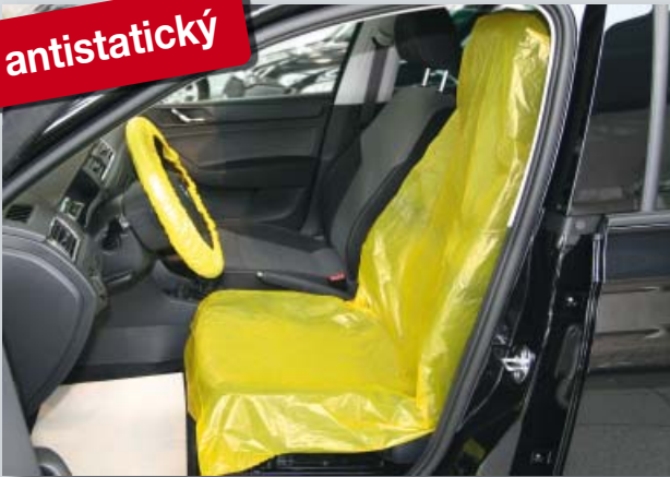
Potah na sedadlo „antistatický“ (Datex obj. č. D-E 3000 **)

chrání elektronické přístroje od elektrostatického výboje, vhodný na všechna samostatná sedadla, z extra silného polyetylenu, s antistatickým podílem materiálu, žlutá rozlišovací barva.