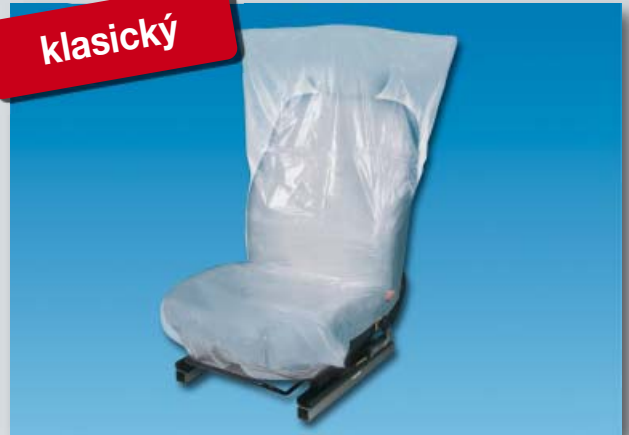
Potah na sedadlo „Classic“