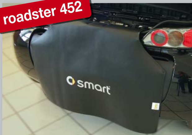
Zadní ochranný potah (obj. č. D-ST 172) smart roadster 452 & roadster coupé 452

Vyrobeno z odolné černé koženky s vrstvou pěnové pryže, s logem smart, podporujícím image dílny. Uchycení bez poškrábání, bez magnetů.