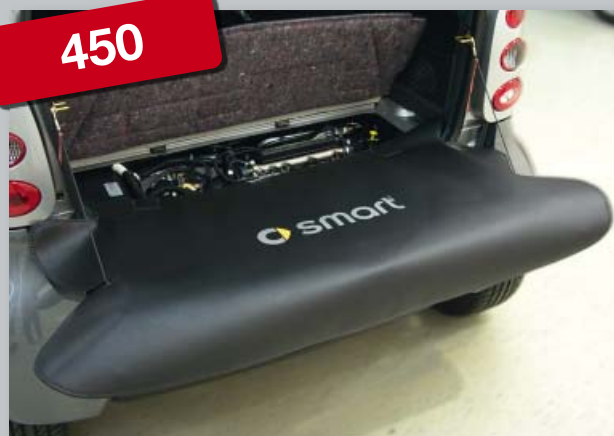
Zadní ochranný potah (obj. č. D-ST 170) smart fortwo 450

Vyrobeno z odolné černé koženky s vrstvou pěnové pryže, s logem smart, podporujícím image dílny. Uchycení bez poškrábání, bez magnetů.