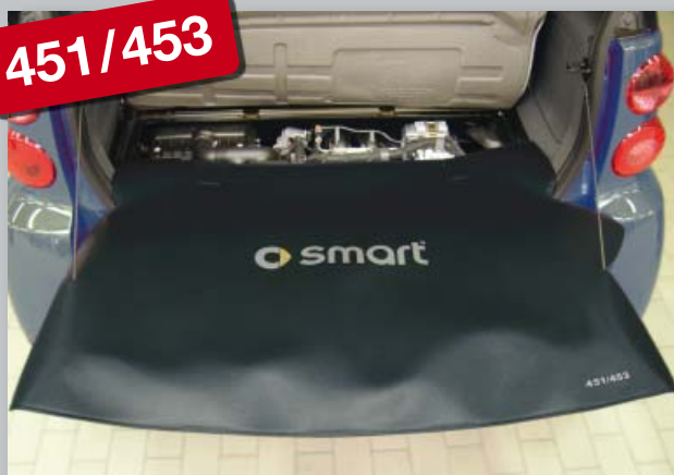
Zadní ochranný potah (obj. č. D-ST 174) smart fortwo/forfour 451/453

Vyrobeno z odolné černé koženky s vrstvou pěnové pryže, s logem smart, podporujícím image dílny. Uchycení bez poškrábání, bez magnetů.