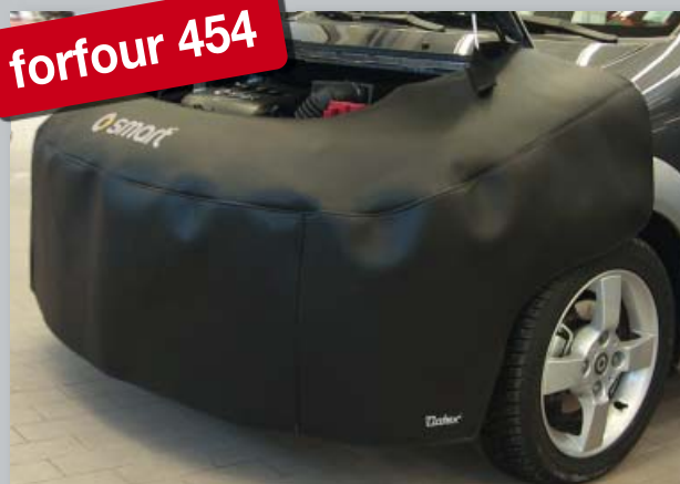
Přední ochranný potah (obj. č. D-ST 171) smart forfour 454

Vyrobeno z odolné černé koženky s vrstvou pěnové pryže, s logem smart, podporujícím image dílny. Uchycení bez poškrábání, bez magnetů.